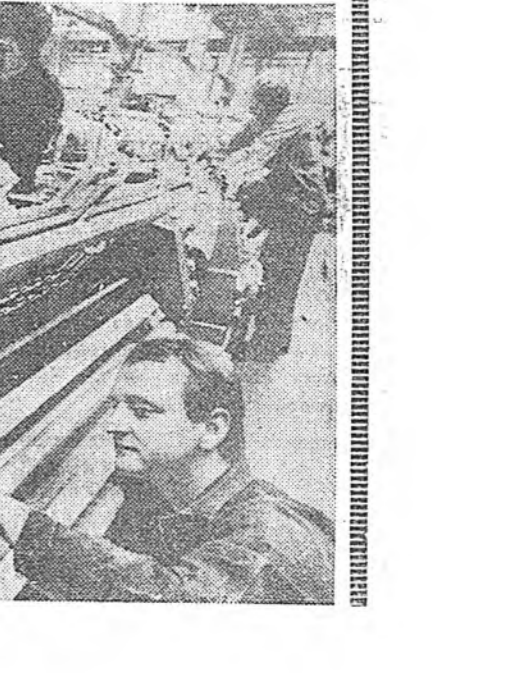
Уулай ажал... нийслэл... байр... үйлдвэр... (Caption for the first image)