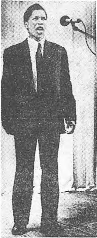
Авиазаводой соёлой «Расвет» байшанда...