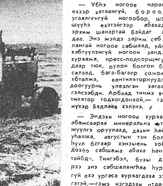
Убһээдэй үбэ бэлдэхэдэбди — гэжэ асууба- бди.