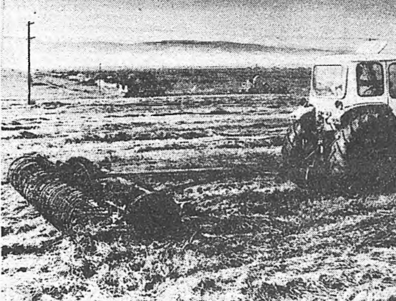
Убһээдэй үбэ бэлдэхэдэбди — гэжэ асууба- бди.