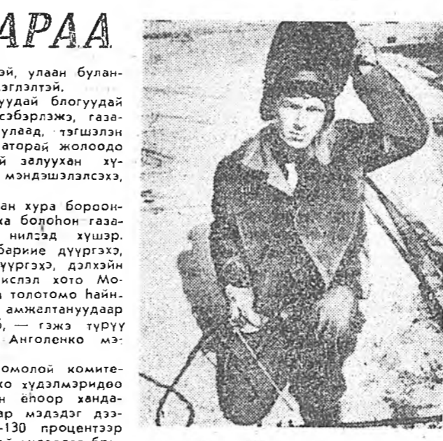
Фестивальда зориулагдажа, залуушуулай хабардалгагаар янза бүрийн олон хэмжээ абуулангууд үнгэргэгдөө, фестивалин үдэрнүүдтэ һонирхолтой үсэхэлтэ абуулангуудэй үнгэргэхөөр харааланхайбди, — гэжэ В. Прокин хэлэб.

Зураг дээрэ: 36 найрамдал тухай дуу монгол делегатууд гүйсэдхэжэ байна.