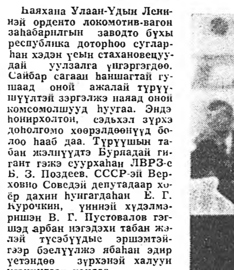
Хаяхаан Улаан-Удын Лениной орденлокомоторноо занабарилгын заводто бүүхэ республика доторхо сугларган хэдэн үеин стахановцуудай уулзалга үнэгэрэгдөө.

«Стхановска хүдлөөнэй 50 жэлдэ»-гай ажалтай ажал 30 неделдэ» гэжэн уриа дору мурьсээжэ, хүдлэмэрин үнэтэй сагыё аша үрэтэйгөөр, дүүргэнэй материал арбалдаг, үдэр бүрингөө даабариа 125—130 процент дүүргэхэ, башэндээ олоо мянган хүдлэмэришэд өхө анхарал хандуулдаг.