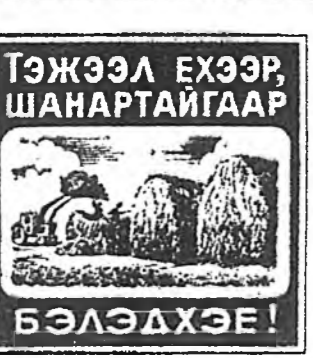
ТЭЖЭЭЛ ЭХЭЭР ШАНАРТАЙГААР