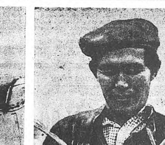
Улаан-Горхоной хийд урматой...