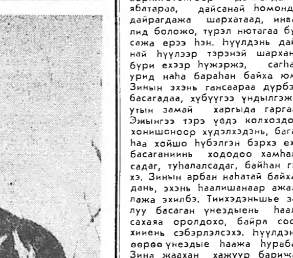
Хуушанайнгаа заншлануудыг мартануудыг...