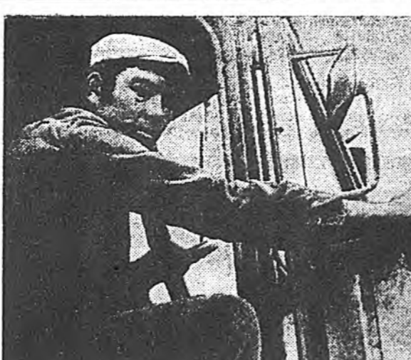
Хвагтын-Адагай гахайн-комплексийн хүдэлмэрийн үйлдвэр...