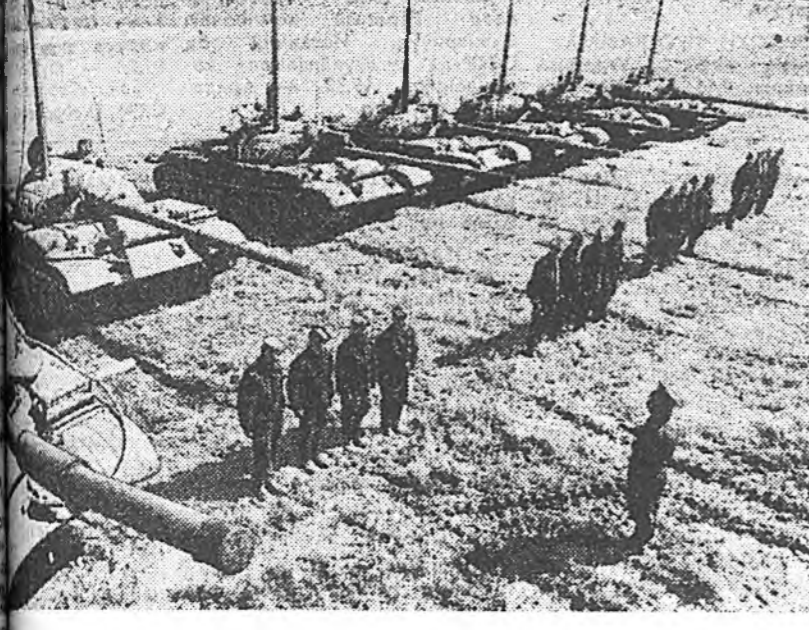
Эрхэм ажалай алдар суу Варшава. Энэ бүтээгдэхэн «Бумар» гэж тамгатай барилгын болон ошон хэрэгсэл тухээрэлгэнүүд улесхооронд дээгүүрт эхээр суурьдаг...

ЗУРАГ ДЭЭРЭ: Танкистнууд тактикаса хэсхэлэй үедэ.