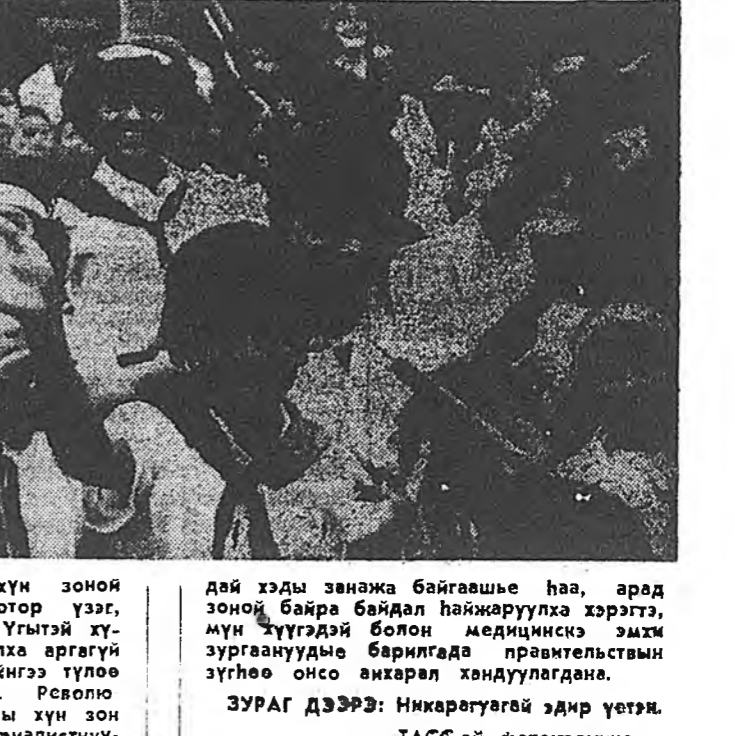
35 найрамдалта хараа шэглэлен дэмжэнэ. Энэ нь... (Caption text describing the photo)