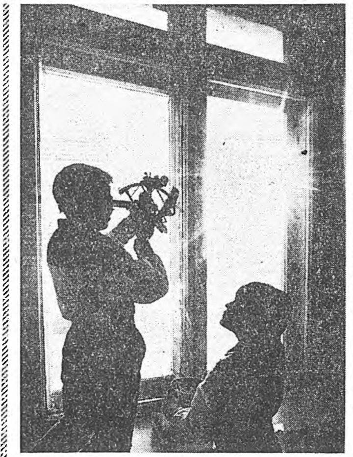
«БҮРЯД ОРОН-35» ГЭЭН ФОТО. ЗУРАГАЙ КОНКУРС

хэрэггүйл, Хэнһе тэрэһини шамда Хүсөөр шудхаха уулгахагүйл.