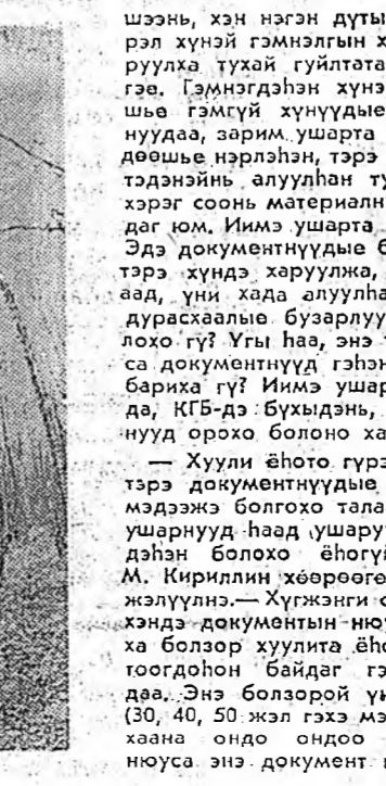
Урхад юундэ таряалдана орооб? гэжэ асууба. — Баяр даалгагдан газраар эрхэд, голэй эрье наадалаа ябашоо, — гэдэнэ үхибүүд даряа табилдаба.