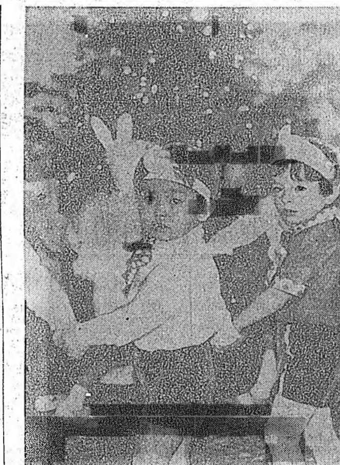
Шэнэ жэлэй һайндэрне нэн түрүүн үхибүүд тэмдэглэдэг. Тэднэй энэ һайндэртэ эртэнхээ бэлдэжэ шонэ шүлэг, дуу-нуудыо эсхэлдэдэг, элэрбэн костюмуудыо оёдог.

Урхад юундэ арьяанда орооб? Рассказ. Энэ юугээ хэжэ байнаш! Шамда даалгагдан газраар хургад таряалдана орошоо, гэхэдэнэ, нүхэдэнгөө шанга шангаар хүхирлэхэе һаал дуулаба.