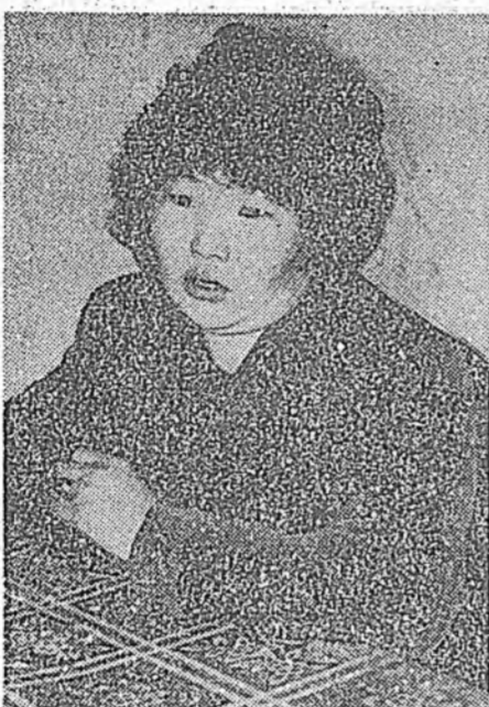
Гадхан хүдэлхэдөө үнээн бүриөө 3800 килограмм һу хаагаба. Жэжээн, жэжэй һуул һара — декабрьда үнээн бүриөө 317 килограмм һуул абтаа.

Нилээд бэрхтэй сэг боложо байЭдих хөөр, үндэхэ хубсаһангаа эхил, бүхэ юумэн хөөр болоо. Эндэ тэ хөмөрөө, үймөө, шаг шууан бол гэж үдэр бүри шахуу радиогоор цажа, телевизээр хаража, хэблэлдэ шажа байдаг, хүнэй ханаа сэдхэлдэ эхүүндэ.