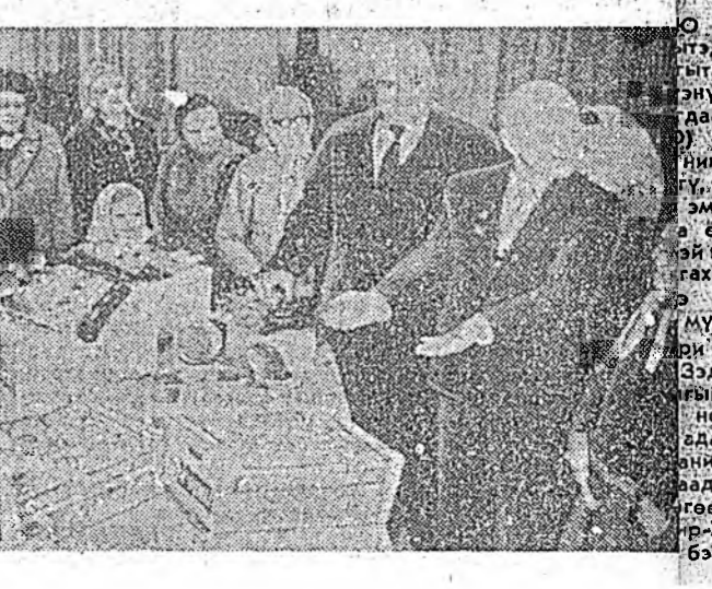
«Урталдмэришэдэ ажаллаха арга боломжогүй байдаг бэбэй. Тимэһээ цехэй хүтэбэрлэлгэд худалдмэришэдэй хайнаар хүдэлэх эрх нүхээл байгуулхын тула элдэв арга боломжо бэдэрдэг байгаа.»