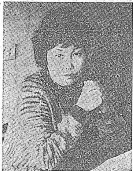
Гэхэхэ эхилдэ бодомжлоодо, юрэнхы шэнги аад, орёо асуудалнууд олон даа...