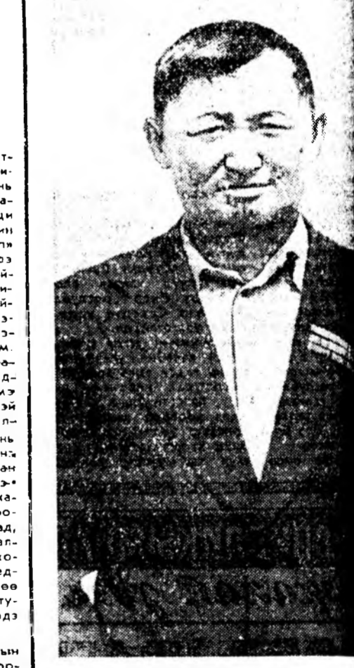
«МАЛ ХАРААМА ТӨҮӨД»