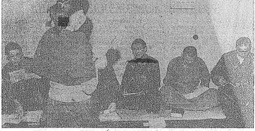
Ленинград хотын Приморско республикын элбэ районунда болон Улаан-Үдэ хотодоо элбэ хуурууд — ерээдүйн лагерь манай хураан.

Эхэ хүн хадаа энэ дэлхэймнэй эхин, анхандаа түшгэлдэ өхэ найдалын гэжэ бидэндэ үнэйгэй элг. Ган гулматга сахихада, ури хүгээдэ хүмүүшүүлхэдэ, ажал хэрэгээ эрхилхэдэ, буряад эхэ илангага шадман гээдэ, Ага нотагэй хүн бүхэн ухаа орохохо эхилдэ, Ага нанаһаага эсэд хүртээр эхын нангин хургаал сахиха ябадэг.