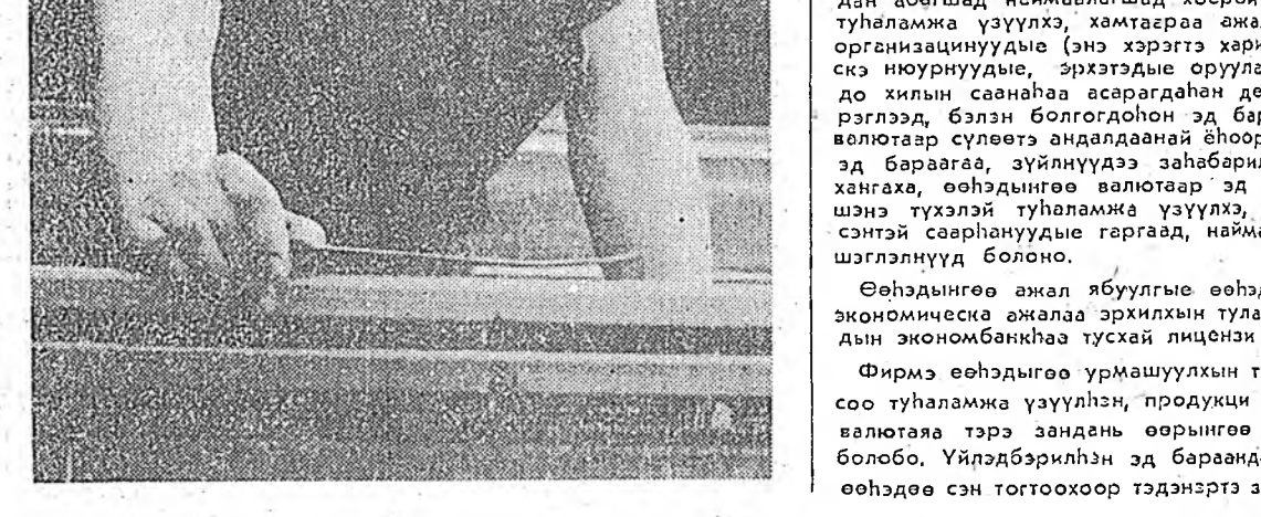
Нютаг нугаса хэр мэдэнэбиди?