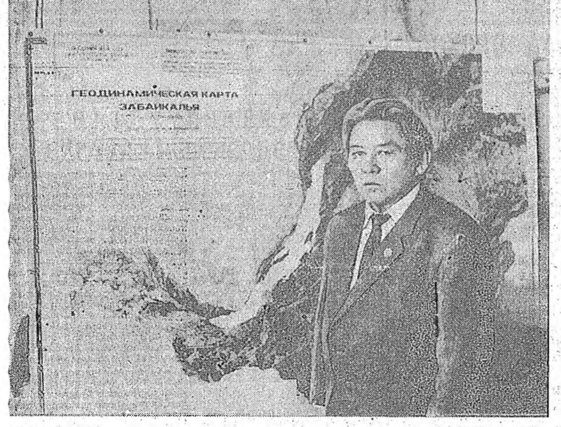
Арадай депутат хөөрэнэ