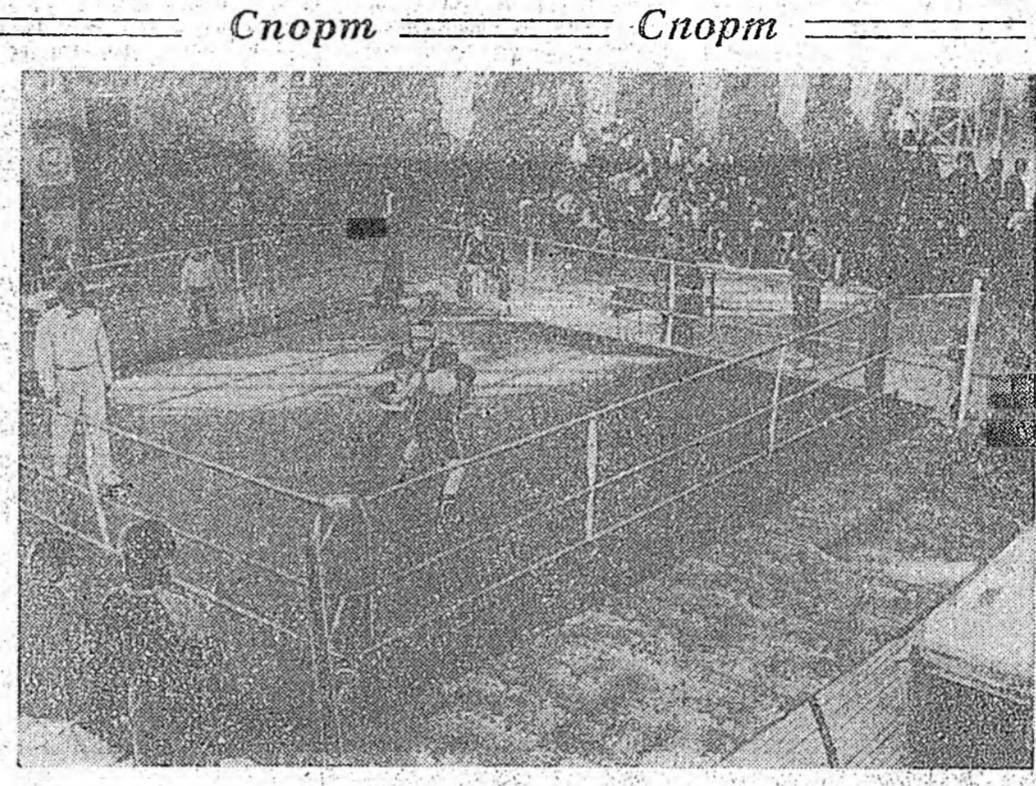
Спортны элдэб зүйлүүдээр үнгрэгдэжэ байхан мурисөөнүүдтэй манай республикын ху...