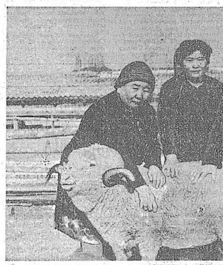
Арбан үхнүүдэй эхэ, эсэгэ Сасэг Емельяновна, Бата Кочиндович Шинковостон Намга гэжэ гоё найхан нэрээтэй нотагта үбэлжээ юм. Эдээр найханайнга амартагдаг газар башые, хонишонооро худаллан зандаа...