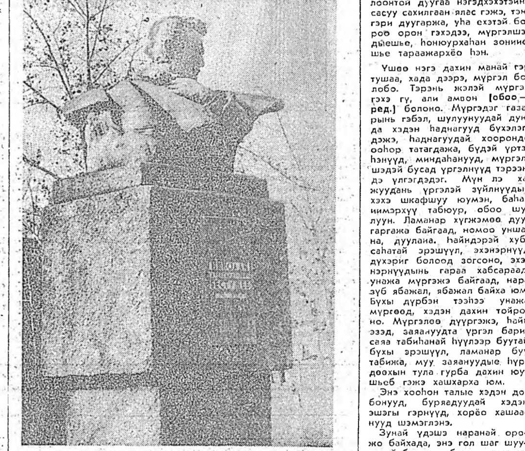
«Табан аха, дүүнэр байгаабли. Декабрин 13-най эрьюулгэ соо булта хосороо нэмдн».

Бурядууд гэжэ ямар иргэнтэй хэсн бэ? Н. А. Вестужев, 1830 он.