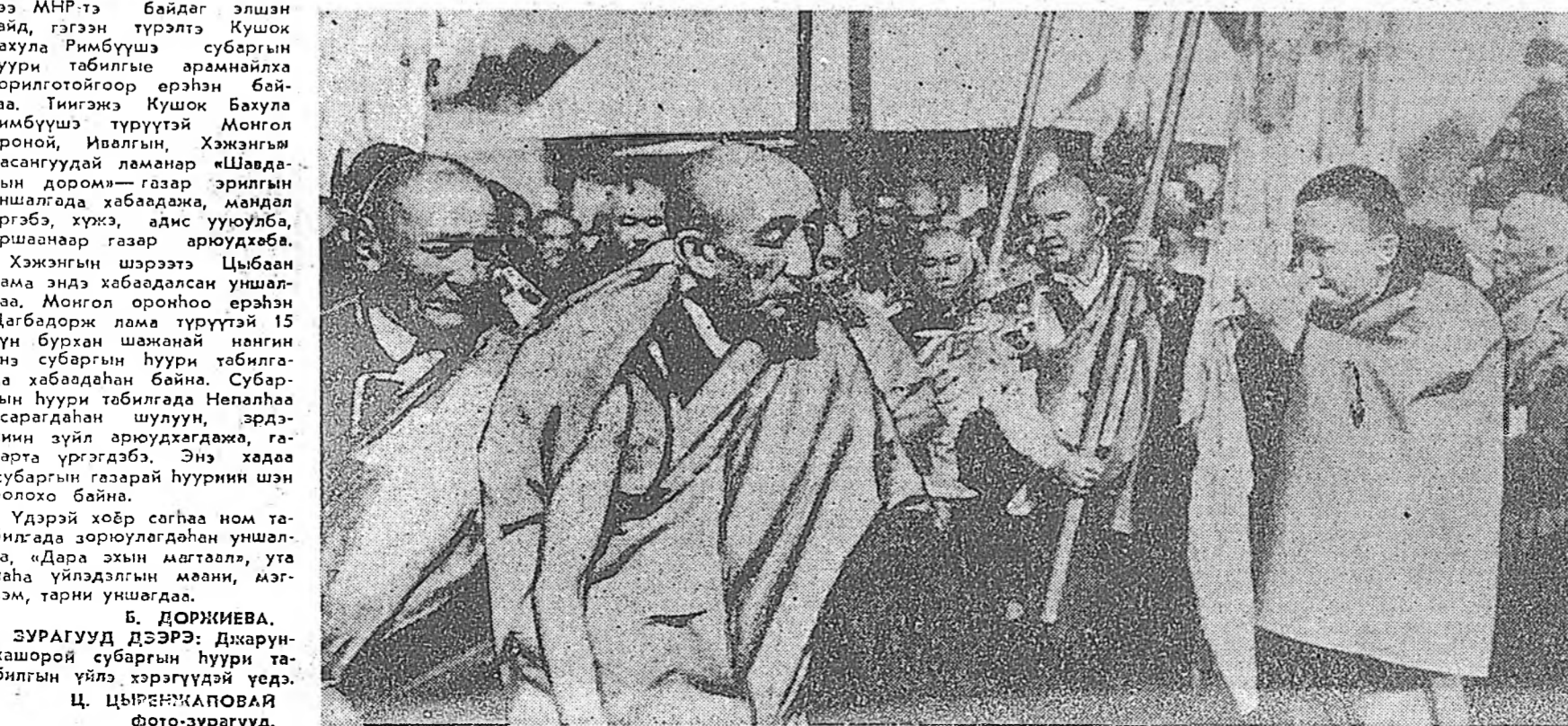
Удэрэй хоёр саһаа ном табилгата зориулагдаһан уншалга. «Дара эхин магтаал», ута һаһа үйлдэлгын маани, мэг-ээм, тарин уншагдаа. Б. ДОРЖИЕВА. ЗУРАГУУД ДЭЭРЭ: Джарун-хашорой субаргын һуури табилгын үйлэ хэрэгүүдэй үедэ.