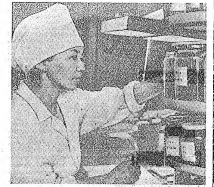
Улаан-Удэ зүүн зүгэй медициннэй эм домто ургамалуудай фитопатекс бин юм.