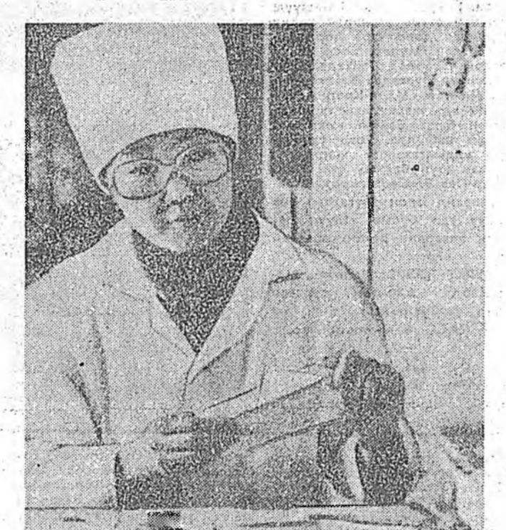
Улаан-Удэ Хүүин Октябрьскай районий Столбовой үйлсэн 56-дахн гэртэ зүүн зүгэй медициннэй эм домто ургамалуудай фитопатекс бин юм.

Элинсэг хүлинсүүдэйнгээ хэрэгдэдэ байхан уушан монгол хэлэ, бэшэг шудалаа наа, найн юм бээ. Юуб гээдэ, революциин урда тээхи буряад литературка, бурхан шажанай ном энэл хэлэ, бэшэг дээрэ бэйлэгдэжэ хэлэ юм. Энээн тээшэ анхэн хэлгээдэ байна. Онсолбол, олохон хургуулинуудай хургалшад энэ хэлэ шудалаа эхилээ. Бага энэ хэлэ үзэхэ дуртайшуудай бүлгүүд эхилдэгдэнэ.