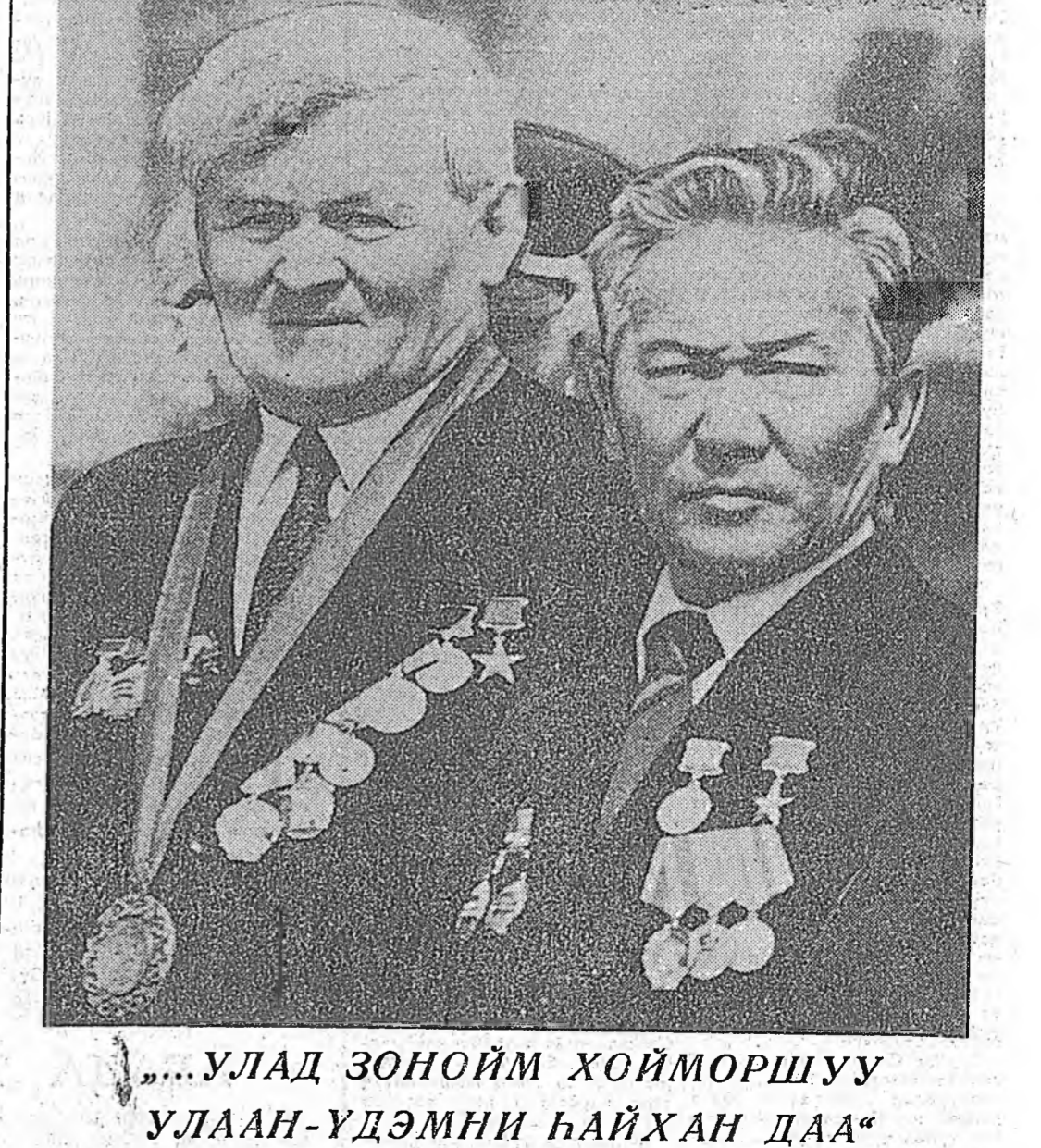
УЛААН-ҮДЭМНИ НАЙХАН ДАА

Улаан-Үдэмни найхан даа Улаан-Үдэ хотын 325 жэлэй үнэрбэ... Энэ нотагаа манай хамта мандуулая!