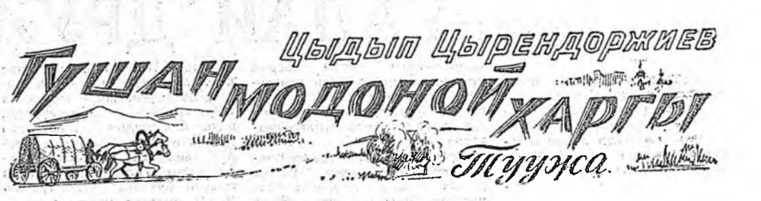
Цыдыл Цырендормиев ТУШАН МОДОНОЙ ХАРГЫ Түүнсэ.