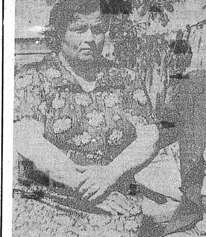
АША ТУХАТАЙ БАЙХАНЬ ДАМЖАГҮЙ

Юрэдөөл, элдэб шатын хүтэлбэрлэгшэд үйлдэбэрингөө хэрэгүүдээр «эжнэлүүлшоод» лэ, оршон тойрхонини ханахашье аргагүй байдаг. Гэбэшье обществэ бүхыдөө экологин асуудалда хандасага хубилгажа эхилээ. Экономическа, социальна хэды хүндэ байдалай тогтобошо, байгали хуушанайкараа ашаглаха туримай үшөө завида байгашье хаа, оршон тойрхонини хамгаалха хүдэлмэридэ найдал түрүүлэн алхамууд хэгдээ.