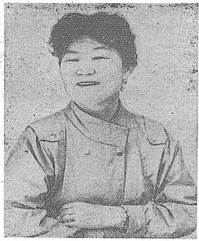
Түрэл даамнай (орон ба буряад хэлхүүд дээр).