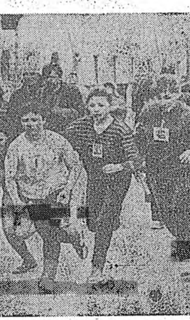
Нютаг нютагай һонинууд

Энэманай хүн бүхэнэй физкультура, спортло дуратай боложо эхилхынэ гэршэлэе бшуу.