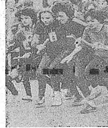
Нютаг нютагай һонинууд

Нүүлэй үедэ физкультура болон спортын үндэсэй хуури хараа байла хайраар. Мүнөө Петропавловка, Селегинск, Кабанск, Мухар-Шэбэр, Турчатово, Нижнеангарск, Ивалга, Баргажен тосонуудта, Гусиноозерск, Северобайкальск хотонуудта найн, зохиод стадионууд баригдаһан, хуушануудын шэнэлэгдэһэн байжо юм. Замаксын хото болон Хэрэн тосхондо стадионууд шэнээр баригдажа байна. Эрээ жэлдэ үбэлэй, зунай худөөгэй спортын нааданууд тус районуудта үнэгэрэгдэхөөр хараалагдана.