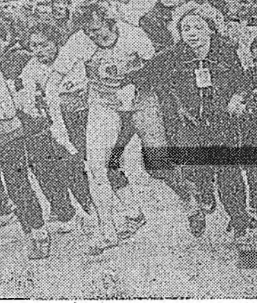
Нютаг нютагай һонинууд

Нүүлэй үедэ физкультура болон спортын үндэсэй хуури хараа байла хайраар. Мүнөө Петропавловка, Селегинск, Кабанск, Мухар-Шэбэр, Турчатово, Нижнеангарск, Ивалга, Баргажен тосонуудта, Гусиноозерск, Северобайкальск хотонуудта найн, зохиод стадионууд баригдаһан, хуушануудын шэнэлэгдэһэн байжо юм.