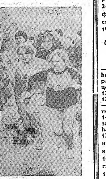
Нютаг нютагай һонинууд

Ургэн Буряад оройной спортсменууд хүнгэн атлетикээр, һур харбалгаар, дүрэ буяалдалгын барилдаанаар, гижир дүрлээр Эхэ оройноо холо саагуур мэдээжэ болонхой.