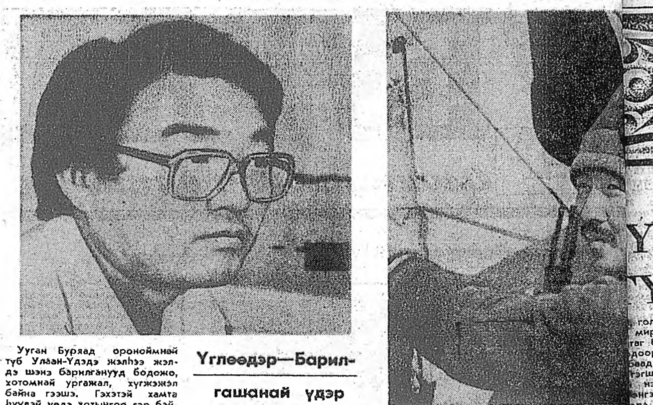
Уган Бургад ороноймнэй түб Улаан-Үдэдэ жэллээ жэлдэ шэнэ барилганууд бодоно, хотомай ургалал, хургажэл байна гэшэ. Гэхэй хамта түрүүгүг үедэ хотынгоо гэр байринууде дулаагээр гэхэ тү, али халгун ургалар замэ гүгсэд хангахаб гэсэн асуудал илангаа нинарай, үблэйсэгта түн зоной ханаа сэдэхэ зоболог болохой. Анхан барилдана жарвад жэл болохо байн турүүшүн ТЭЦ-эй элхэ хүсэ мэдээжэ. Тимэлээ хотын гэр байринууде халуураг хангалса ходо элхэ ТЭЦ барилдана байна. Зүгөөр ашгалагада орууллагын жэл бүхэдэ хойшооулагдана, удаарна. Гэхэй хамта, хүмүүдэйгээ бэрхирэгүйгээ, эхэн хэрэгсэлгүйгээ гэдэгтэл, сашаада түн зоной хүлээхэ өргө халсанга. Энэ ушар шалтгаанаар эндэ ажаллэй хэр хэдэжэ байнэ харахаа тэмэхэ өшобобди.

Хуралсалай "Байгал" ажамхын хэргүүд тухай олондоо дээжэ байха ёстой. Манай хахи түрүү хүн зоноороо, эрх мэргэжлэдээ, ажанга эрхим дунгуудээр урхадг ааб даа. Гэбшье нөө, дэлгэрүйгээ экономоик дамжан оролгын үедэ ажага олоо оршотой болгош шухала зорилгонуудай гэн болоно.