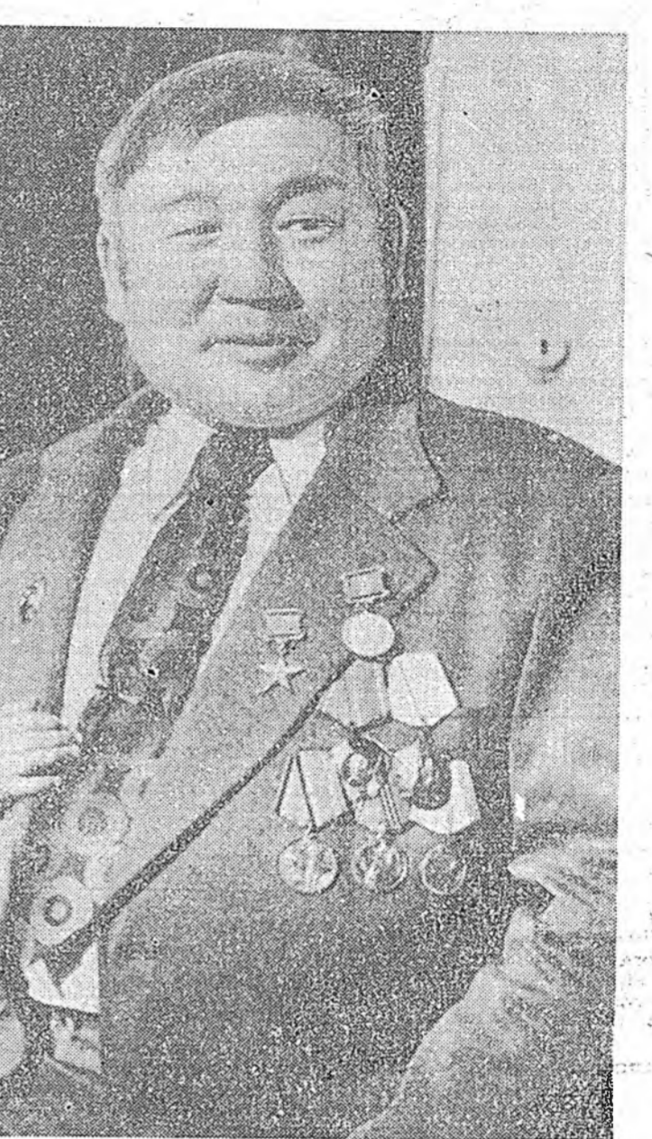
Түрэнэн нотагтаа түрүү зэргэтэй

байдаг. Тэдэни мүнөө үеын малшад мэдэнгүй. Тимхээ хэйнэ ямар онол арга, дүй дүршэл хэли абахаяа үшөө ойлгоногүй. Химин бодосудые оруулжа бэлдэхэн тэжээл эднэн мал ямар шанартай маха, һү үгэнэб гэж арад зоншын мэдэнгүй.