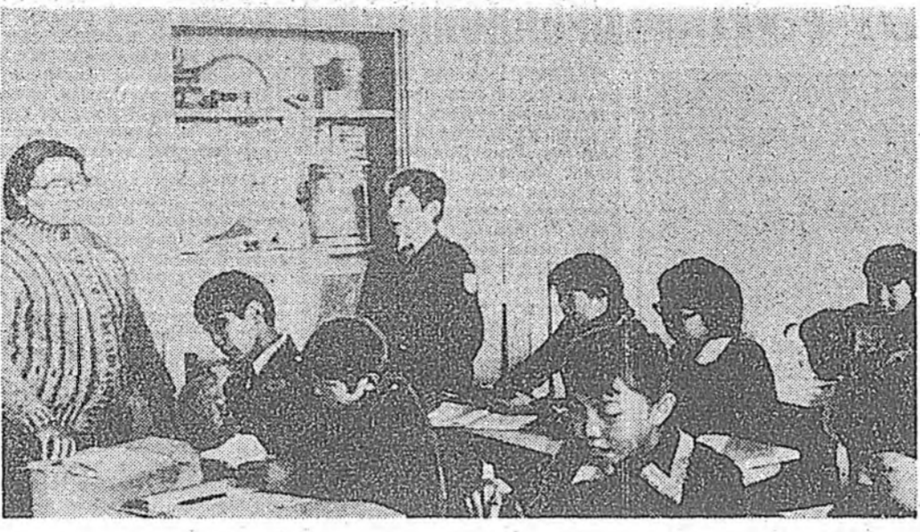
Хургахайн хэлний үндэсний үзэлтэй хамт, энэ хэлээс хургахайн хэлтэй гэрлэж, үзэлтэй хамт, энэ хэлээс хургахайн хэлтэй гэрлэж...