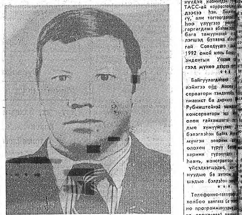
ДУЛААНАЙ ЭЛЕКТРЫН ЭЛШЭ ХҮСЭН ДУТАЛДАНА

СЕВЕРБАЙКАЛЬСК. Буряадай республикын эгзэн залуу Северобайкальск хотодо дулаанай элшэ дуталдажа, Сибирийн хүйтэн үбэлэй үедэ байрын гэрнүүд, һургуулинууд, хүүгэдэй саадууд болон бусад эмхнүүд соо тон хүйтэн болонхой. Энэ хэсүү байдалай гол шалтагын гэхэдэ, түлшэ дуталдана. Пилотматериал, рельсүүд, шалануудыне элгээгээгүй һаанай, 130 мянган тонно шулуу нүүрһэ элгээгээгүйбди гэжэ нэрлэдэг. Энэ хэсүү хэвдэ дулаанай элшэ дамжуулагда «БАМкоммунэнерго» хотодо дулаанай элшэ дамжуулагда захилы дүүргээ шалдгай байга бшуу. Дулаанай элшэ хүсэний дуталдаха, электривн элшэ хүсэн баһа хүрээгэ ядадаг болло.