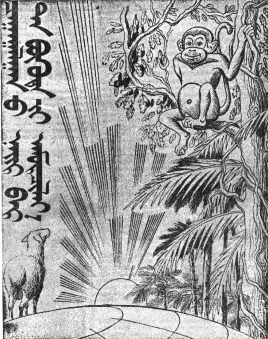
Уран зурааша Р. АБИДУЕВАЙ зураг.

Бурядай ССР-эй Министруудэй Советэй Түрүүлэгшэ В. САГАНОВ. Бурядай ССР-эй Министруудэй Советэй хэрэгүүдые эрхилэгшэ В. ПОТЕХИН. Улаан-Үдэ, 1992 оной январин 30.