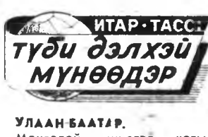
ИТАР-ТАСС түди дэлхэй мүнөөдэр

Хото городуудта дунда ээргээр ажанууһын тула һарадаа — 347, харин хууде нотагуудта 216 түхэриг хэрэгтэй болозо гэһэн мэдээһэл МОНЦИАМ агентството тарьяһан байна.