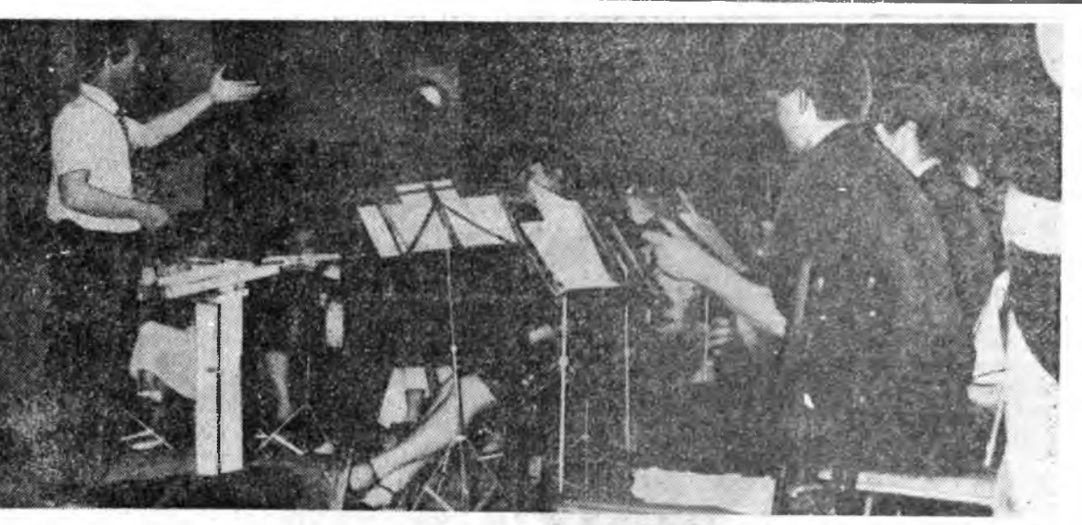
П. И. Чайковскийн нэрэмжэтэ Улаан-Үдын училищин 60 жэлэй ойдо