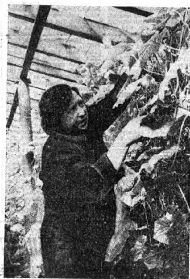
ЗАХАМИНАЙ оньожоруулагдамал ойн ажахын хүтэбэрлэгшэд коллективэйнгээ хүн зонин соднэнь талалаа хамгаалха асуудалда онсо анхардаг. Илангаяа мүнөөнэй бэрхэтэй сагта олон айл бүлэ ехэ сэнгүүдээ ялалана ха юм.

Улахоорондын хэрэгүүдэй ба гадаадын экономическа холбоо барисаан талаар комитетэй болон парламента хуулин талаар сэнгэлтэ үгэхэ тухай асуудал зүбшэн хэлсгэдэ гэжэ Россия Вер. ховно Советэй хэлбэлэй түб мэдээсэ. Россия гадаадын хэрэгүүдэй министр А. В. Коэврев элидхэл хээн, удаан арадай депутатуудай асуудалууда харуосхан байна.