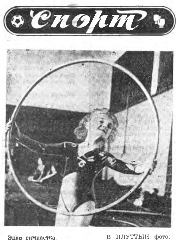
Эдир гимнастка. В ПЛУТТЫН фото.

гэйн хоёр мур эжэлүүдгүй хангагдахна. Уран дархаша нотагнй — Уужам тоонто Нуртамнй