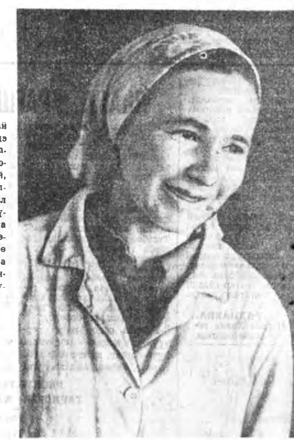
«Байнал» гэжэ һуралсаад ажахыда Гурьэлын фермадэ 300 наамаан үнэтэй 8 наа...