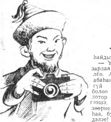
Албанай хэрэгээр худөөгөөр ябахад үедөө Хушан Хурбэдэ нэгэ танилданса...