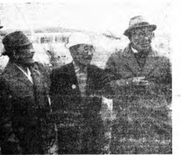
Доодо-Ушоотэй урда оршоон ариун хон добо ээрэн жэлүүдэдэ бол-хоолохо эрдэмтн хүсөөгэй эхин шу-луунан дэргэдэ нютагай үбгэдэ Доржи Банзаровай эхэ, эсэгнн хотон буусын эндэ оршоон тухай ама дамжан эрэнн нютагайгаа домог айшдаа түүрэнэ.