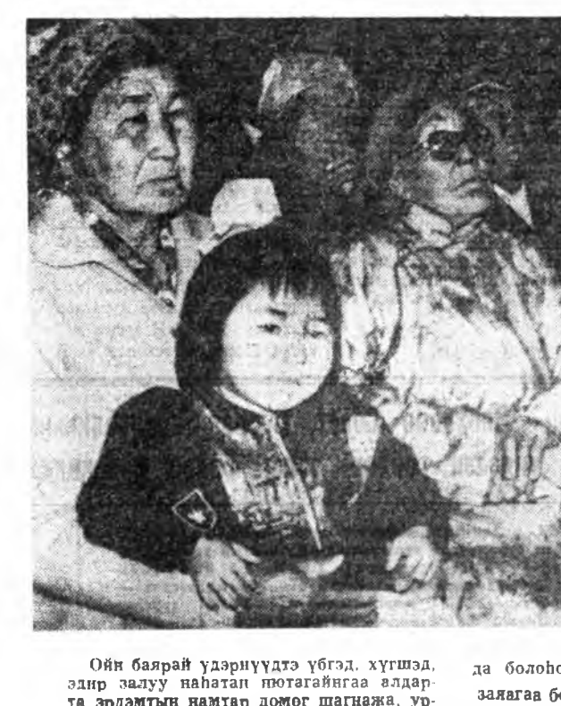
Ойн баярай үдэрүүдэдэ үбгэдэ, хүгшэдэ, эдир залуу найхан нютагайгаа алдарт эрдэмтн намтар домог шагнажа, ур-да болоһон түүхээс хойшодоо болохо залагаа бодомжолон бодомжолон бууна.