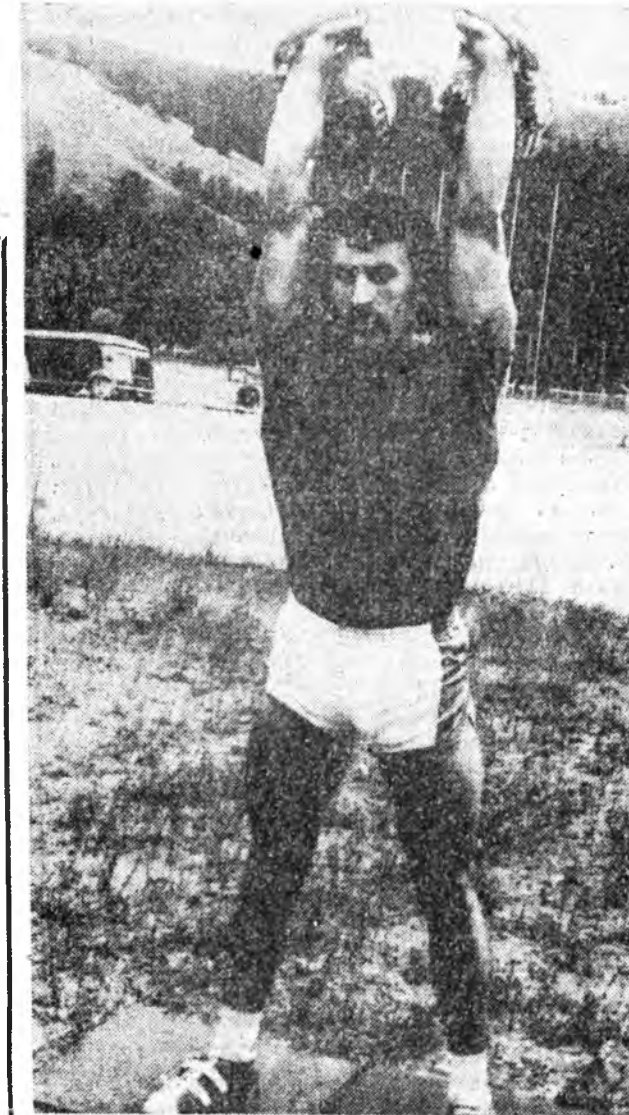
Уг дагагшад баатарнуудай уг дагагшад