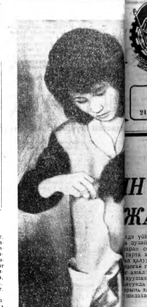
Ушоо, дуулаа хэн гүт?

Япондо, Германида ба Ита- лийда бүтээн гомгадһан ав- томашинануудай запас хэ- рэгсэлүүдэе олохын арга- гүй юм. Монголой нийслэл хотодо япон автома- бильна «Тойота» корпора- цин автоматшчануудай за- пас хэрэгсэлүүдэй магази- ние нээһэн ушар үйлэ хэ- рэг хубилгаа.