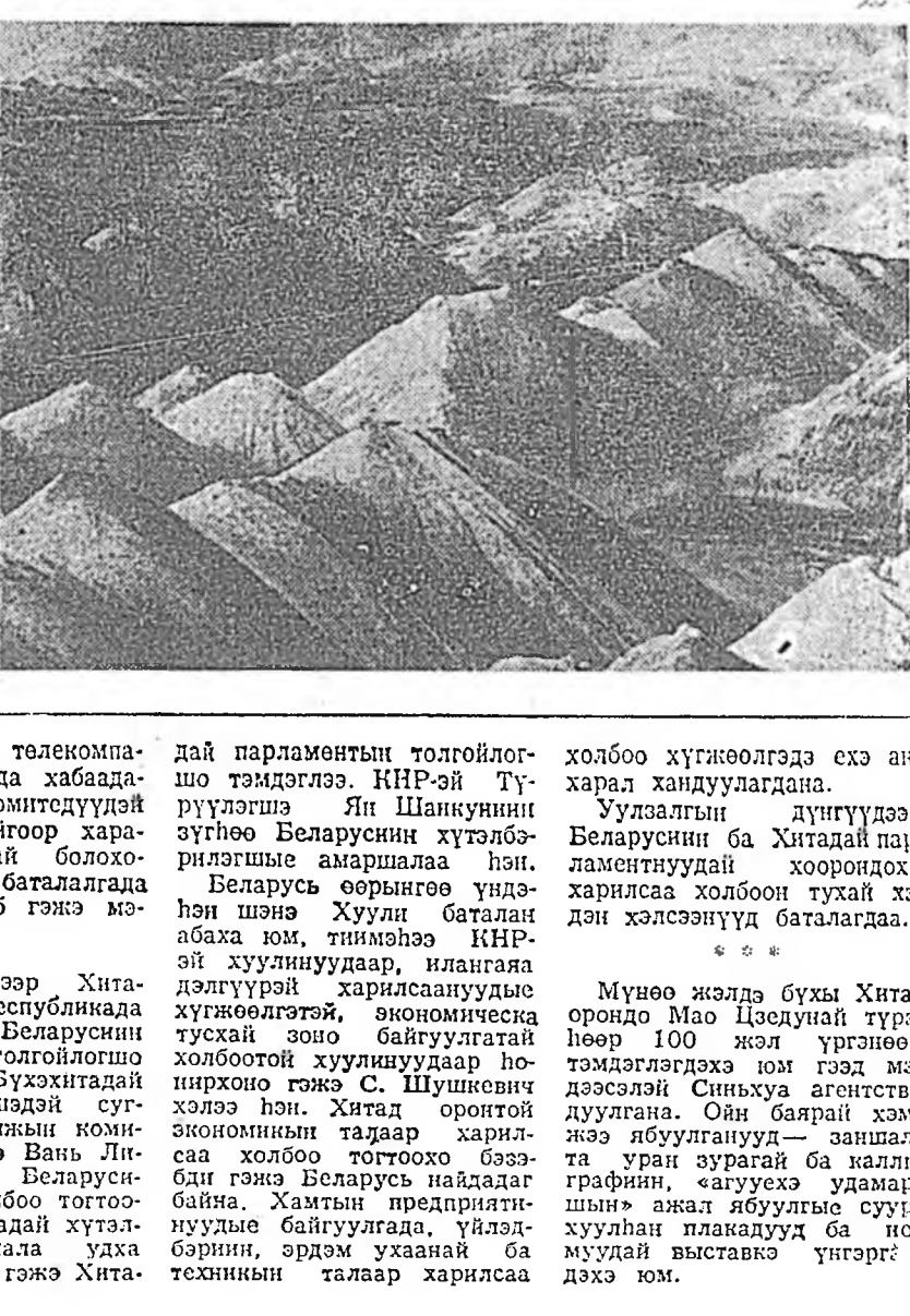
Р. ИРИНЧЕВА, уншганга.