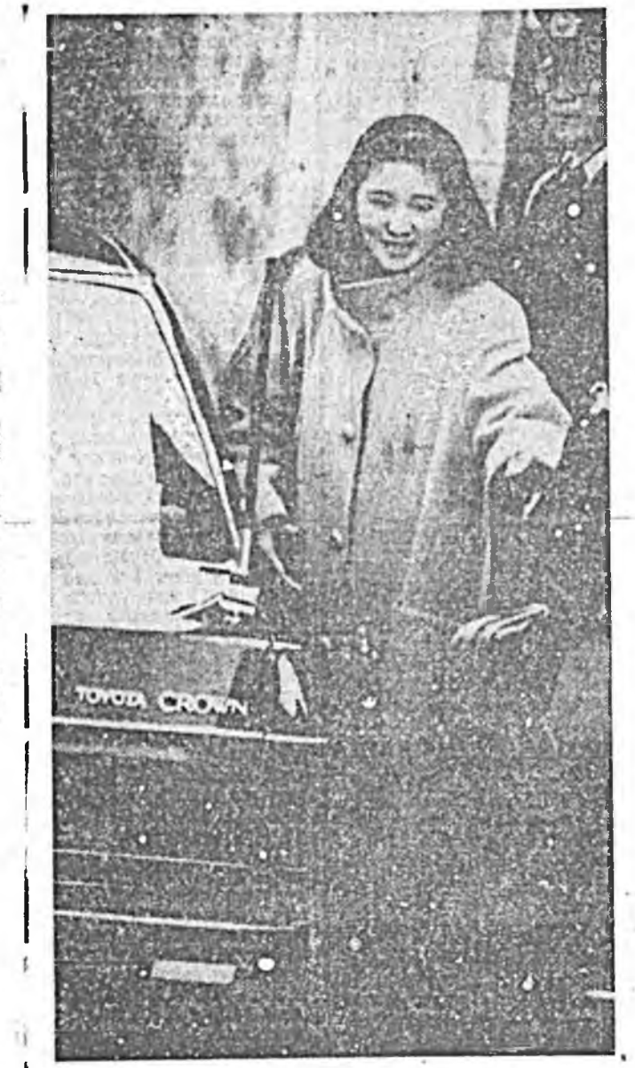
Токно. Нёдондо жёлэй һүүл багта орон соо хүлэгдээгүй һураг суу сахилгаан мэтээр таража, олоной анхарал эхэтээр татаба.

Урда Хиллари Клинтон Арканзаста юристээр хүдэлхэн, хүүгэдэе хамгаалха нигитын жасне ба байгаалы хамгаалтын асуудалуудаар өмбөлөгдөн совдэй хүтэлбэрийд байган юм ха.