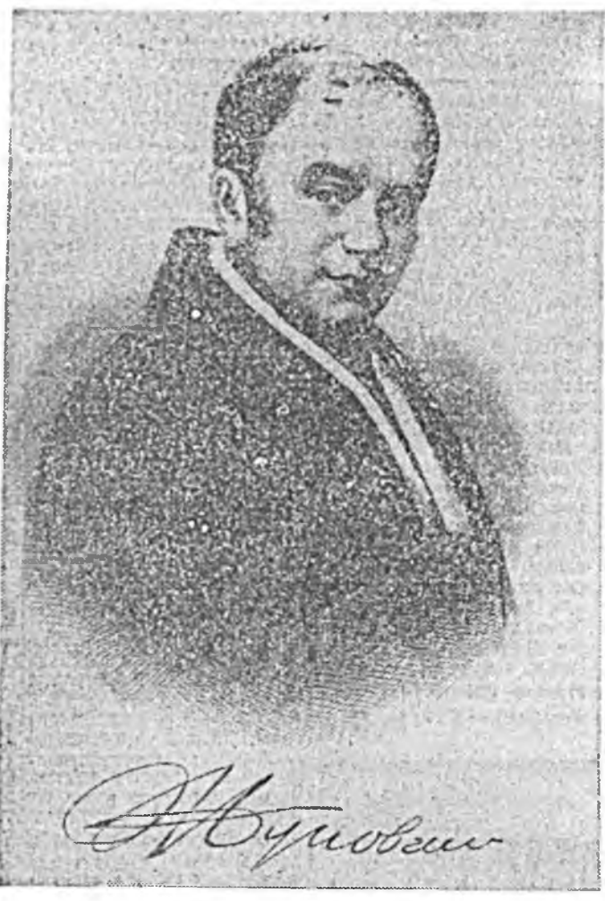
Ородой агуухэзэ поэт, ород романтизмын үндэрэ һуури табигша В. А. Жуковскийн түрөөр 210 жэлэй ой фотр-лиан 9-дэ гүйсээ.

ЗУРАГ ДЭЭРЭ: В. А. Жуковский, ИТАР—ТАСС-ай фото-буулгабэри.