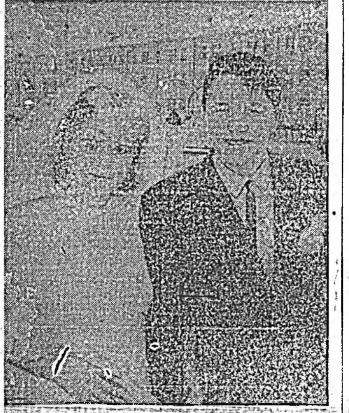
МҮНӨӨНӨН хүшэр хүндэ сагтаһе ажабайдалтай үргэлжлөөр...