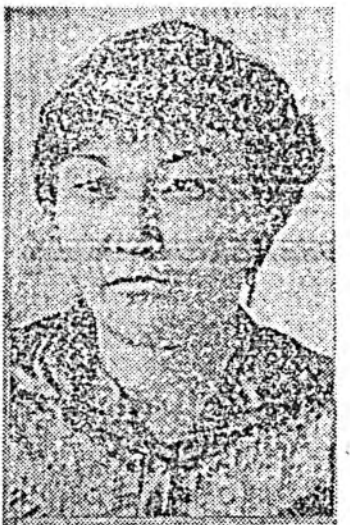
М. Ч. КРАСНОВА, Сэлэнгэ аймгай Карл Марксын нэрэмжит колхозой Дээд-Юрөөгэй хүнэй фермэ.