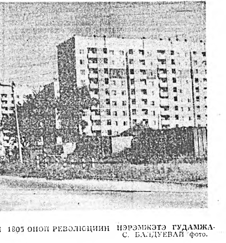
ШУУДЭ ХОТЫН 1905 ОНОЙ РЕВОЛЮЦИНН НЭРЭМЖИГЭ ГУДАМЖА