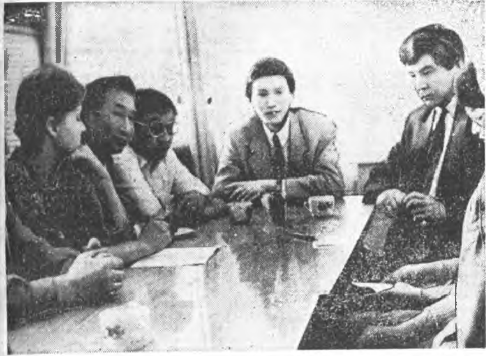
Манай республикын 70 жэлэй ойн барта олон айлдаа буугаа юм. Тэдэнэй — илгэн — Хальмаг Республикын Президент Кирсан Николаевич Илюмжинов. Тэрэнэй абуудлаг реформонууд, юрэнхидөө бүхы ажал хэрэгүүдэй Хальмагтай мүнөөнэй байдал республикын арай зондо хонирхолтой байгаа еһотой гэж бодомжлоод, интервью абаха хү...

Хальмагтайн байдал тухай. Байша оной апрелин 11-д Хальмагтай түрүүшүн Президентын хунгалта одоошье бодогор үнгэргэгдэе. 1991 ондо энэ хунгалтын үнгэргэхэ гэдэн аад, хэрэг бүтээгү бэлэй. Юуб гэхэд, засагай хоер талаа — хуули зохион гаргалгын ба гүйсэдхэхын — зуршилдөөд байгаа бичүү. Гэбшье эсэсэй Хальмаг Республикын Верховно Совет энэ хунгалтын үнгэргэхэ гэдэн шийдхүрн декабрь нарада гарта. Апрель нарада болохо байгаа хунгалта хүрээр үшөө уды, энэ хугасаа хо хууда-барна хаа даа. Мөншье наад түгээ үшүрүхэ, өөһдөөшье республикын Верховно Совет ба Министрүүдэй Совет эдэ эдбхүгэй, хунгалта хүргээдэ дарагуй байха. Хальмаг орой уг гарбалаараа гурван орой болон хубардаг. Эсэе зурганай зүгөө отогудай, мүн үндэс яһанай хорондо хөөрөө үүдхэхэ ушар үзэгдөө. Юундэ би энэе тушаа дэлгэрэнгүгээр хөөрөөгдэ гэхэдэ, апрелин 11-д Президентээр намайе хунгалтан, олон орбо асуудлуудые — яһанатай, отогудай, засагай халаануудай