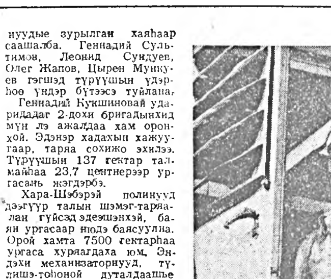
Уржадур Буряд Республикын Верховно Советтэ