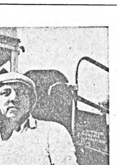
Уржадур Буряд Республикын Верховно Советтэ

Уржадур Буряд Республикын Верховно Советтэ Президиумэй ээлжээтэ засэдааны үнгэрэгээрэ, республикын ажалшад аяналуудай, айнабадалай олон асуудалнууд харгалдан, тодорхой шийдэлүүнүүд баталан абтаба. Энэ засэдааны хуралдаанууд эрдэмтэд, арай депутатуд, гүрэнэй, коммерческ аажануудай хүтэлбэрилгэгшэд хабаадлай асуудалнуудаар наманжа дундаахуудыг оруулан байха юм.