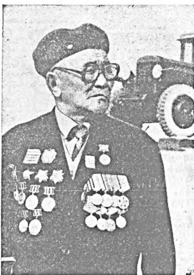
ПӨТӨН ХАРА болотороо хөө уаанда даарагдашан шаровоз нилээд эсээн юумэдэл, ута унжгар ватуудыг уухилан жүдхэнэ.

байжа, шархань түрөөр эдгээ. Дивизионы Моск-вагай обласгийн Красно-водск хото элгээх болобо. Лэгдэн 4-дхи танкова ар-мины нэг полкдо албаан үргэжээгүйлээ. Москва дэ-гүүр танк, машинаудла-раа гарахадан, гороодонд эхэ халуунаар угтаа нэн.