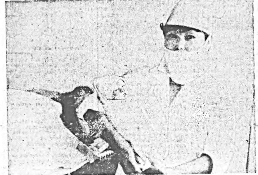
АГЫН ОКРУГОН Могойтын районий түбэй болоншада хэдэн таһагууд бии юм...