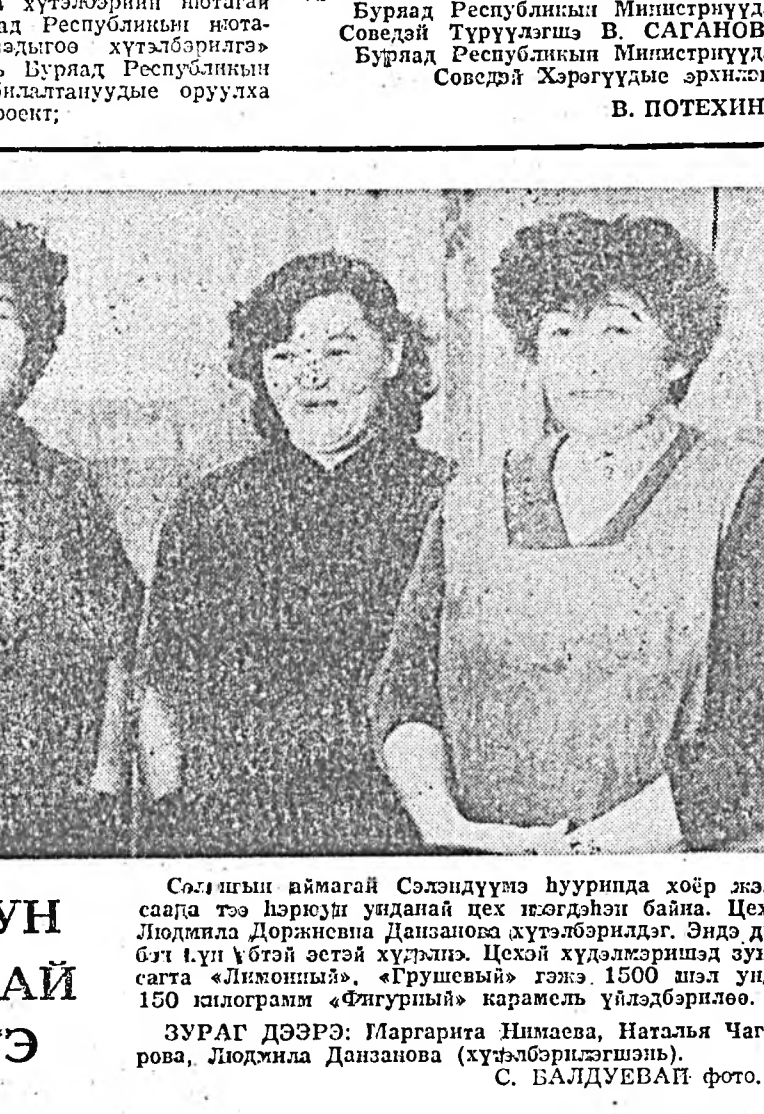
ХЭРЮУН УНДАНАЙ ЦЕХТЭ