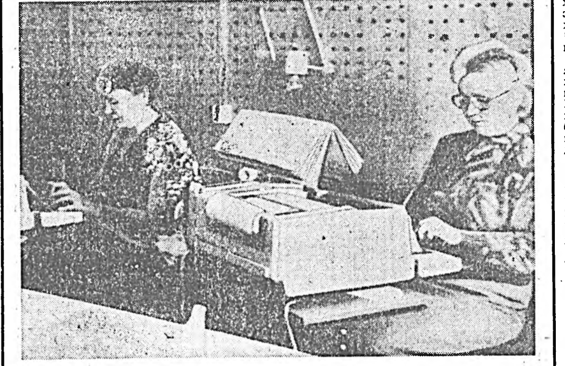
Улаан-Удэн Калининой нэгэмжэтэ долоонхондо дэргэ тэстэй. Эндэ опера-льница дехишкисэ бүлгэмэй 14 оператор худал. Тэдэ-нар бүхы машинистүүдэй сүүдхэ соо дунда жэһээгээр...