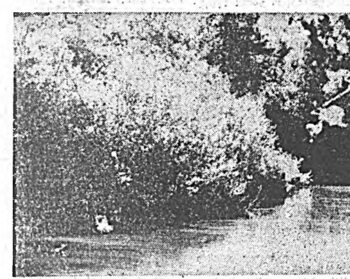
Байгаалин үзэхэһэн һайхан нэгэ буланда...