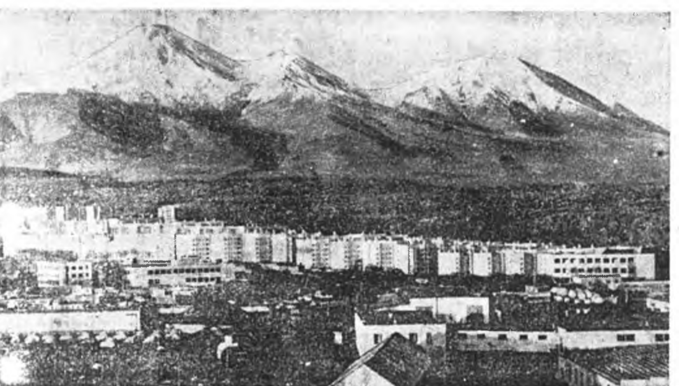
РОССИН ГОРОДУУДААР Петровлавск-Камчатский. Горизонт-Север — городской мэно микрорайонуудай нэгэн.

ОЛОНХИНЬ НАЛАНА Росси дотор айл бүлэнүүд ехэ олоор наладаг болон байна гээд нүүдэй мэдээ нүүд гэршэлнэ. Тинхэдэй жэл бүри хэды айл би болоод, хуульч халаа, 1000 хүн бүхэнд абаад харахад, 4.2-ын халаа байх юм. 1983 ондоо хэды айл би болоод, хэды халаа гээд хараад үзөө наа, хонирхолтой байна.