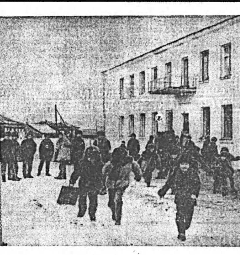
Кабанскийн аймагай Корсаковын дунда нургуулин Бураад орон дотороо эгээл үншэй нургуули гэжэ суурхана. Энэ нургуулин байгуулагданаар 140 жэлэйгээ оие хаяхан тэмдэглэжэ, ниотайнгаа хүн зонинэ, энэ нургуулины элдэб онуудта дүүргэгшэдые баясуулба.